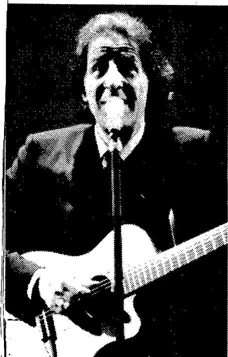
Giorgio Gaber in scena

NAPOLI - Ecco un'altra discesa nel buio dell'inferno quotidiano. E ancora una volta, ci accompagna per mano - al Diana, nello spettacolo «Il teatro canzone» - Giorgio Gaber: questo menestrello dell'ordinario malessere che - un po' glaciale e un po' frenetico, un po' tenero e un po' crudele, un po' disincantato e un po' appassionato - è, indiscutibilmente, il campione assoluto di «full immersion» nell'«inverno del nostro scontento» (tanto per citare il titolo di un romanzo di Lalla Romano che, oltretutto, contiene, giusto, anche la rima con inferno).