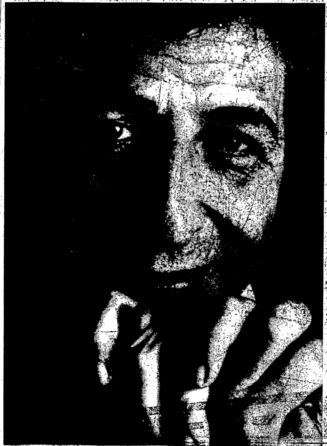
Giorgio Gaber all'Augusteo