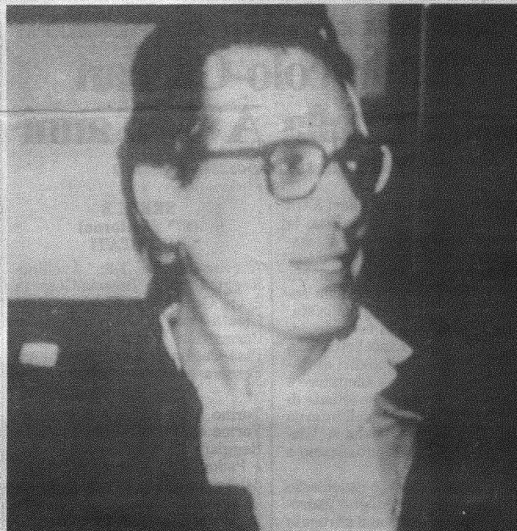
Enzo Jannacci (nella foto), protagonista insieme a Giorgio Gaber e Paolo Rossi di «Aspettando Godot», la commedia di Samuel Beckett che presenteranno venerdì al Goldoni di Venezia